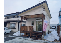
のぼり旗が目印の店舗。店舗前に駐車場も完備