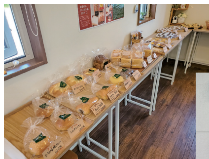
日替わりのパンと一番人気のソフトクリーム

店内には、日替わりで並ぶパンや焼き菓子、ケーキ、プリンなどが華やかに並ぶ。店内で作る花巻市大迫町にあるミルク工房ボン・ディアのソフトクリーム(450円)やボン・ディアのソフトクリームを使ったスムージー(600円)、花巻市fishman coffeeさんが当店のためにブレンド焙煎したコーヒ