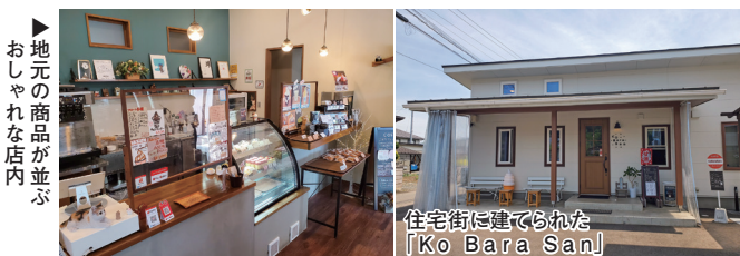
地元の商品が並ぶおしゃれな店内