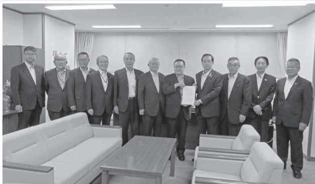
復興庁 角田隆事務次官