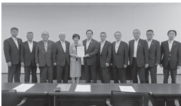
文部科学省 塩見みづ枝研究振興局長