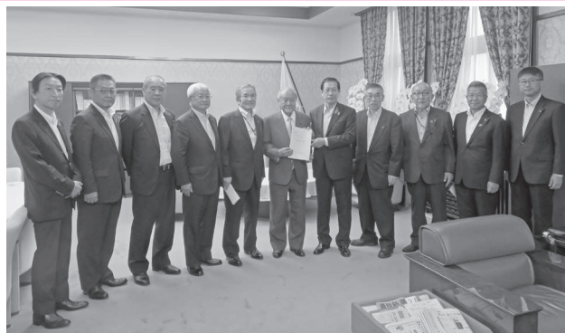
財務省 鈴木俊一財務大臣