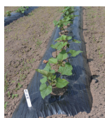
金時のサツマイモ畑