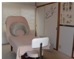
足つぼ療法を行うベッド。心を入れた丁寧な施術で体の不調改善のサポートをする