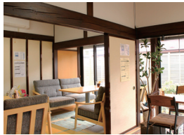
古さと新しさが調和したすてきな店内