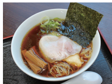
しょうゆ味の「らぁ麺」(850円)。手作りラー油をたらし、味変するのをおすすめ